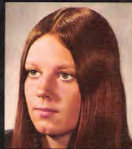
Karen Ann Quinlan

Austria 28 Sch Belgium 30 F Canada 2002 A Denmark 5.58 Kr France 2.54 FF Germany 2.50 DM Greece 1.50 Dr Ireland 1.50 Ir Italy 1.50 L Japan 100 Y Netherlands 2.50 f Norway 5.00 Kr Portugal 200 Esc Spain 166 Ptas Sweden 2.50 S Switzerland 2.50 S United Kingdom 10 p U.S. 1.00 $